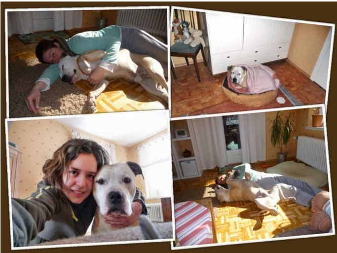
Django in seinem neuen Zuhause

Erinnern Sie sich an unsere allererste Ausgabe der Tierpost? Er war der Hund von Seite eins! Das war vor einem Jahr. Unser Django hat nach mehr als 3 Jahren im Tierheim doch noch eine liebe Familie gefunden, bei der er sich „doggenwohl“ fühlt. Django ist ein vollwertiges Mitglied seiner neuen Familie geworden und das kommt seinem Charakter sehr entgegen. Denn Django ist eine echte Knutschkugel!